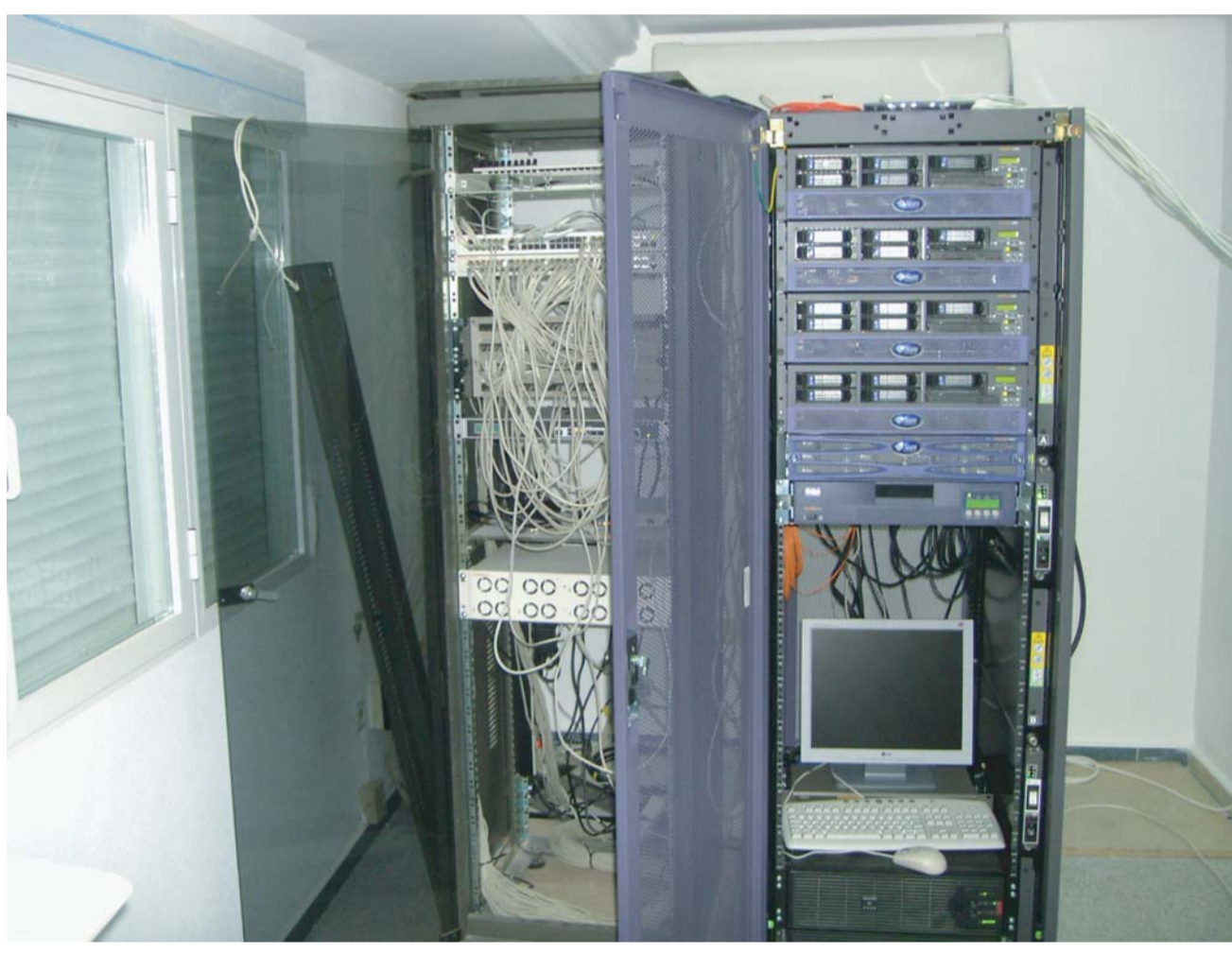
Nueva plataforma de servicios municipales

El proyecto El proyecto de Tomelloso se basa en cuatro aspectos o ejes orientados a la mejora de los servicios que ofrece el municipio a las PYMEs y a sus ciudadanos