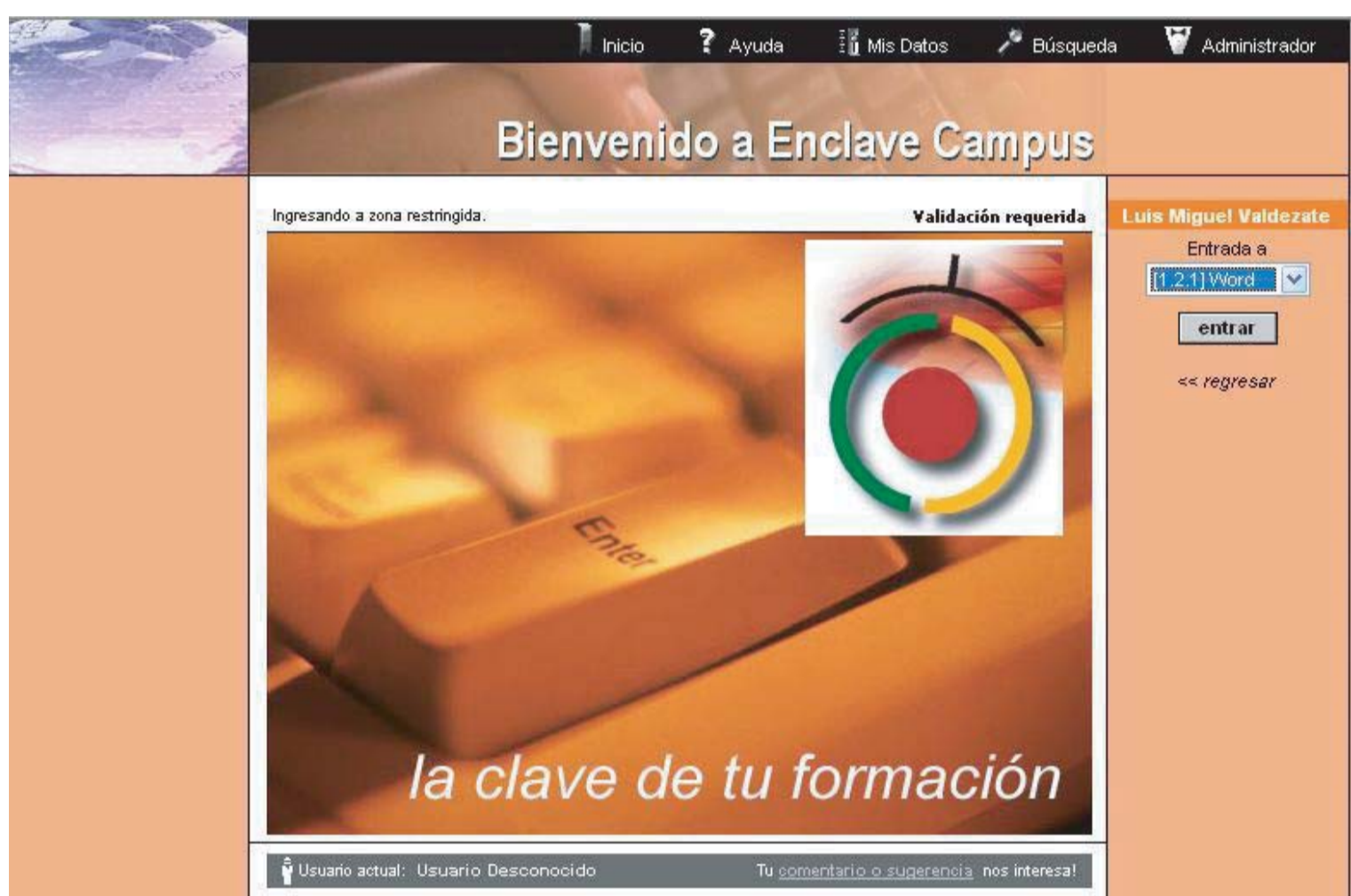
Web de formación on-line