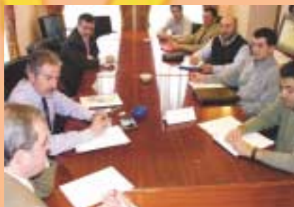
Reunión con la Asociación de Empresarios de Tomelloso

Dada la importancia que estas actuaciones tienen para el conjunto del tejido empresarial de Tomelloso, hemos acordado con la Asociación de Empresarios de la localidad, que formen parte de la mesa de trabajo, que en lo que se refiere a los aspectos funcionales y de servicios, han de definirse, de manera previa a los desarrollos.